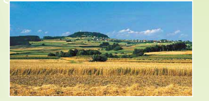
Blick auf den Bussen (767 m) in Oberschwaben – beliebter Wallfahrtsort Oberschwabens und hervorragender Aussichtsort mit Blick bis zu den Alpen