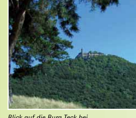
Blick auf die Burg Teck bei Kirchheim unter Teck.