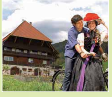
Der Schwarzwald – Tradition und Kultur.