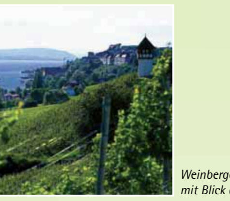
Weinberg bei Meersburg mit Blick auf den Bodensee.