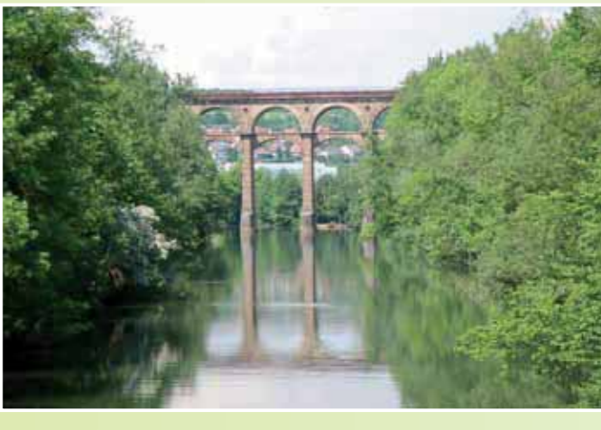
Blick auf das Bietigheimer Eisenbahnviadukt über das Enztal. Eines der Wahrzeichen der Stadt.