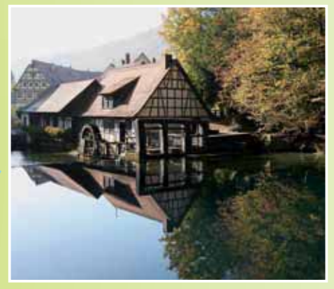
Der Blautopf bei Blaubeuren mit Hammerschmiede.