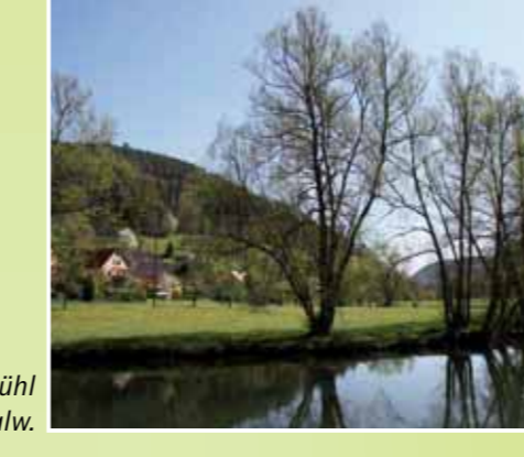
Rund um Erntmühl bei Calw.