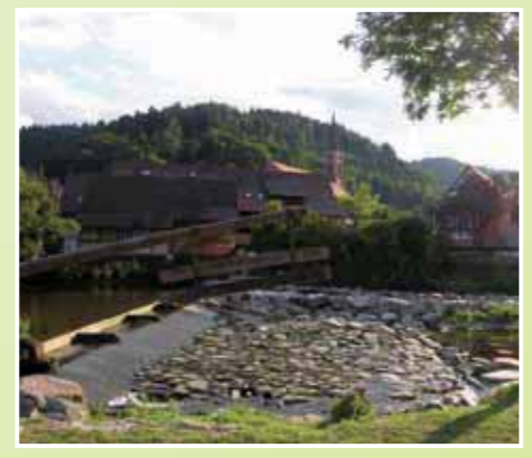
Blick auf Schiltach.