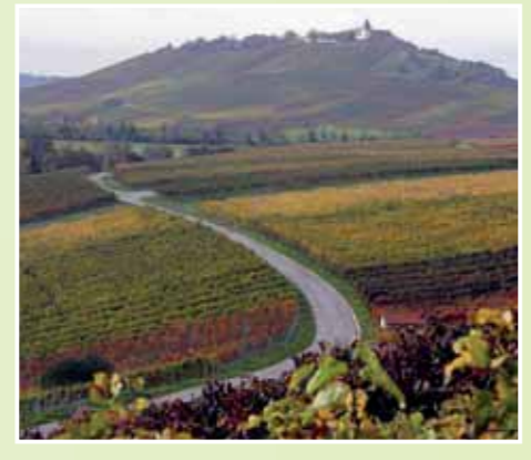
Michaelsberg mit Kapelle bei Bönningheim.