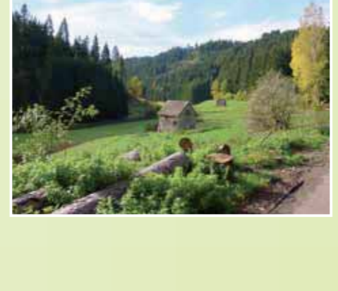
Das Zinsbachtal bei Altensteig mit einigen alten Mühlenstandorten.