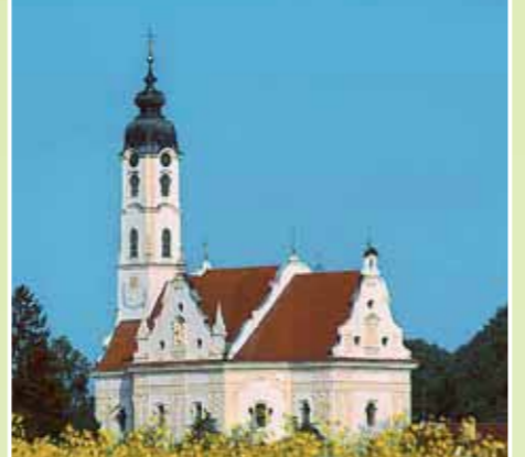
Steinhausen – Wallfahrtskirche und „schönste Dorfkirche der Welt“. Station der Oberschwäbischen Barockstraße.