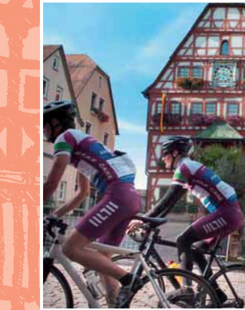
Mit dem Rad unterwegs entlang der Deutschen Fachwerkstraße