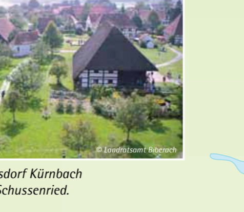
Museumsdorf Kürnbach bei Bad Schussenried.