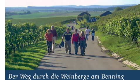
Der Weg durch die Weinberge am Benning

Diese Wegbeschreibung beginnt in Großbottwar bei der Kellerei der Bottwartaler Winzer, Oberstenfelder Str. 80. Neben dem Kellereigebäude befindet sich auf dem Parkplatz der Stand der ● Bottwartaler Winzer . Am äußeren Rand des Parkplatzes bei der Bushaltestelle geht es den