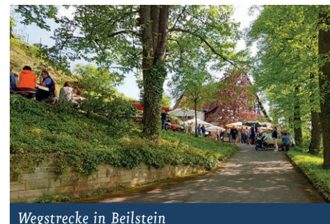
Wegstrecke in Beilstein

rotes Kreuz), geht rechts am Friedhof vorbei und weiter den Friedhofweg entlang bis zur Löwensteiner Straße. Linkerhand ist das Weingut Gemmrich . Auf der Löwensteiner Straße geht man zurück, nach rechts in die Hühbergstraße und bald nach links in die Burgunderstraße. Es geht durch das Wohngebiet am Spielplatz rechts in die Hebelstraße, rechts in die Hermann-Hesse-Str., rechts in die Justinus-Kerner-Straße, links in die Uhlandstraße und rechts in die Goethestraße. Dann folgt man beim Haus Goethestr. 12 der Treppe abwärts und überquert die Schmidhausener Straße, biegt ein in die Breslauer Straße und wandert dann die Berliner Straße leicht abwärts. Am Ende der Straße geht es kurz nach rechts, man überquert an der Fußgängerampel die Oberstenfelder Straße und weiter geht es im Forstbergweg. Er mündet in den Heerweg, dem man kurz nach links folgt. Danach wird gleich rechts nach „Im Köchersgrund“ eingebogen. Vorbei an Firmengebäuden und nach der Wegkreuzung geht es über freies