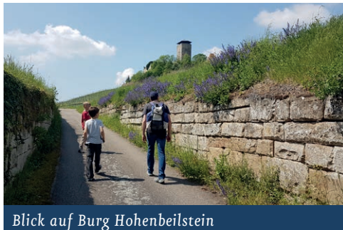
Blick auf Burg Hohenbeilstein

Die Wegbeschreibung beginnt am Parkplatz Burg Hohenbeilstein. Von dort aus geht es in die Weinberge den Hühbergweg hinauf, nach 100 m nach